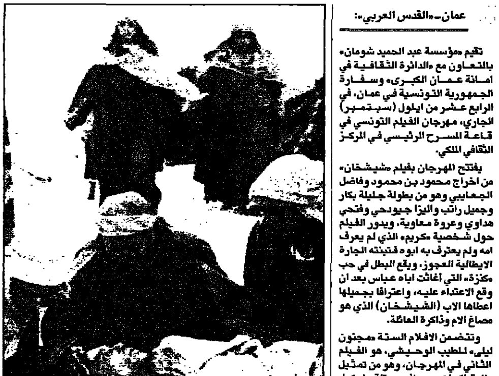
مجنون ليلى، للطيب الوحيشي

عمان - «القدس العربي»: تقيم مؤسسة عبد الحميد شومان بالتعاون مع «الدائرة الثقافية» وإسنادة عمان الكبرى وسفارة الجمهورية التونسية في عمان، في الرابع عشر من أيلول (سبتمبر) الجاري، مهرجان الفيلم التونسي في قاعة المسرح الرئيسي في المركز الثقافي الملكي.